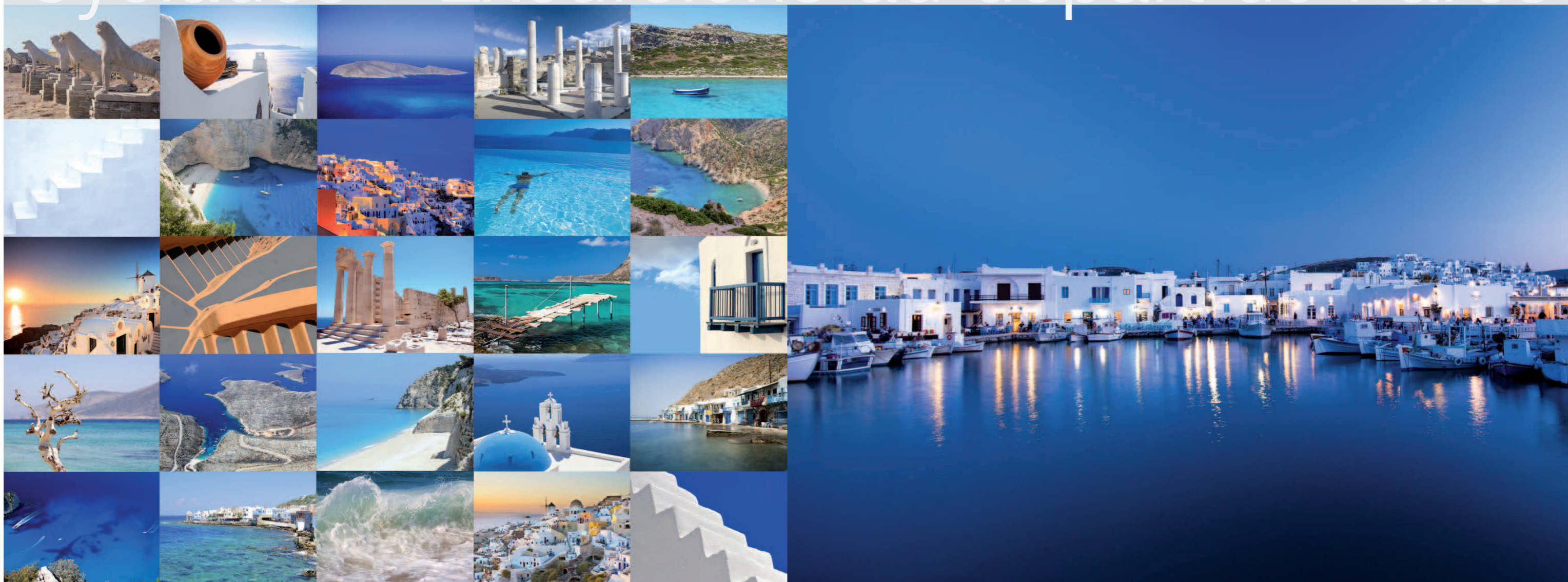
Port de Naoussa - Paros