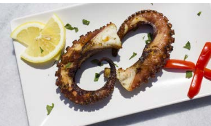
Hôtel Paros Bay