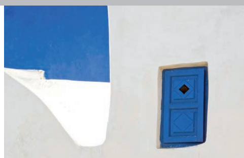
Paros et son architecture Cycladique

Tout Compris : Pension complète , visites, guide et transferts exclusifs. Hôtel Paros Bay. Vols non compris.