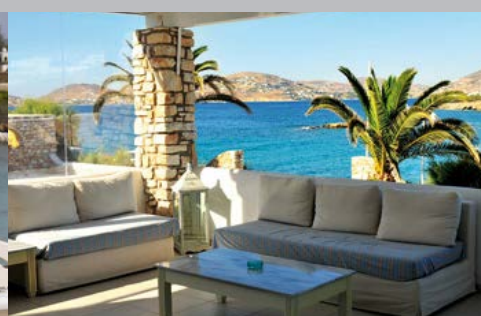
Hôtel Paros Bay

Situation. A 2,5 km de Parikia et 8 km de l'aéroport, l' hôtel Paros Bay 4* est situé en bordure de mer avec une plage de sable en contrebas. Un hôtel francophone, impeccablement tenu et une très belle architecture Cycladique , l'adresse idéale pour des vacances reposantes au cœur des Cyclades .