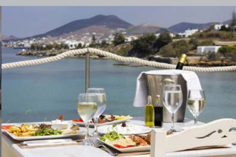
Hôtel Paros Bay