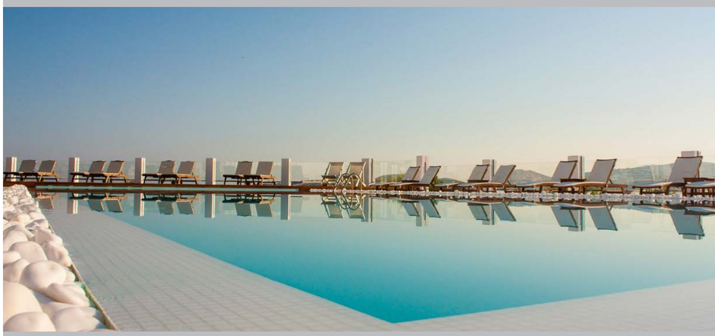
Hôtel Paros Bay