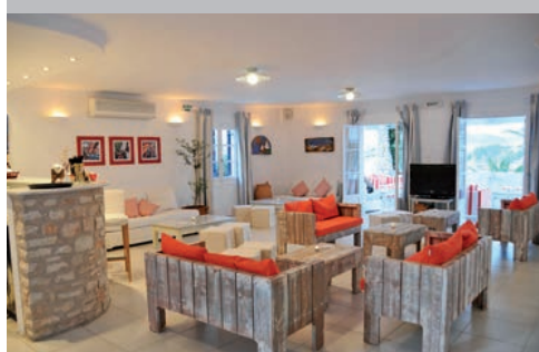
Hôtel Paros Bay