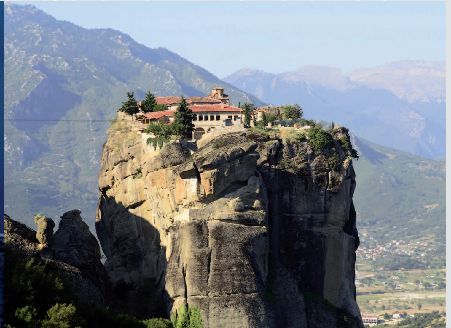
Les Météores - Thessalie