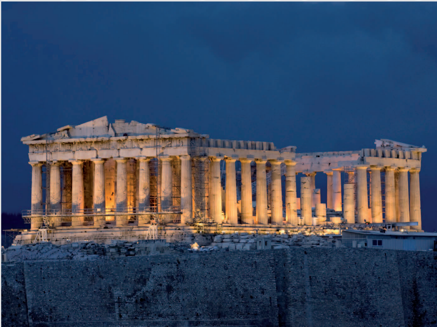
L'Acropole - Athènes